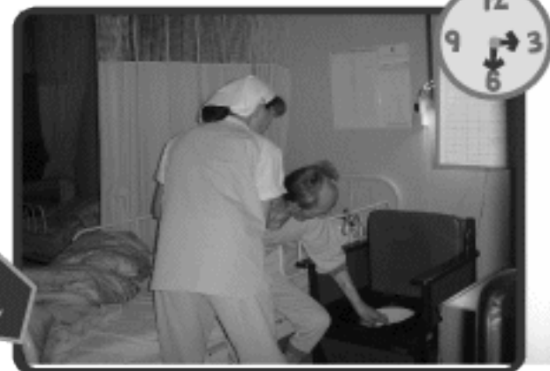
もう少しで夜があけます