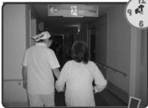
転ばないように... 排泄誘導