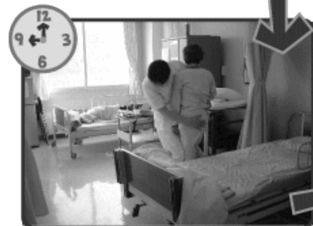
リハビリテーション