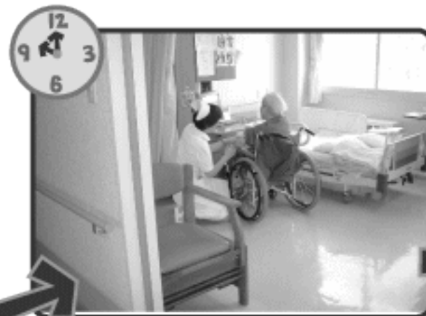
状態伺いや注射に参ります