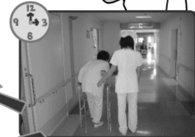
ケアプランに沿って看護を提供