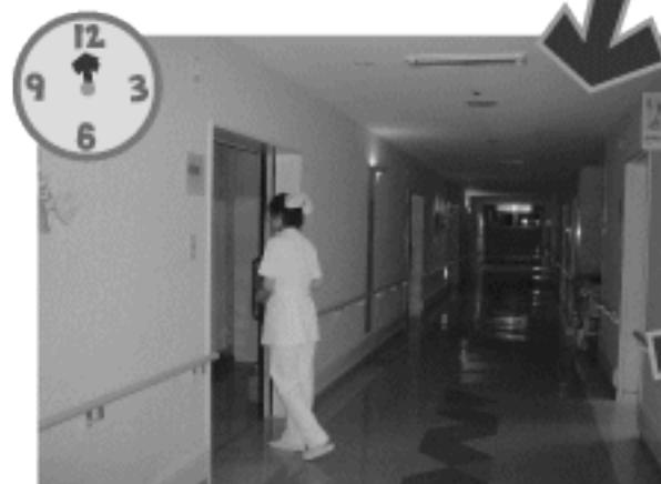
何度も、1人1人見て回ります (巡回)