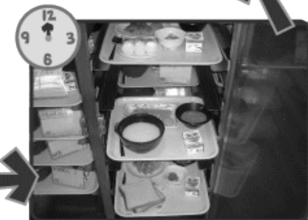
食事は色々ご用意できます