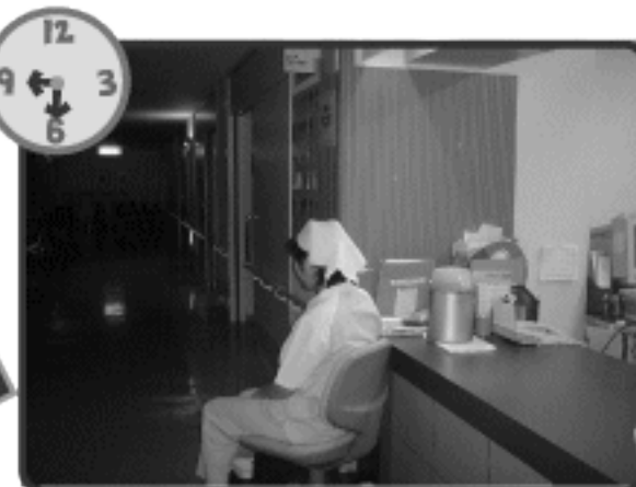
患者様の動きや変化に対応します (夜間の待機)