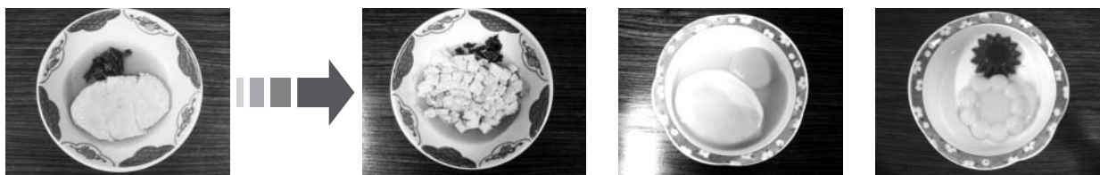
一般食を加工すると... 5分菜食(細かく刻む) ミキサー食(ペースト状) ゼリー食(ゼリー状)