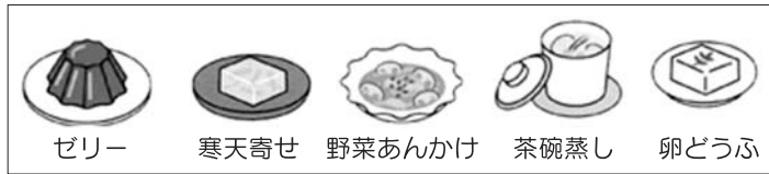
図1:飲み込みやすい(食べやすい)食品例

次に②ですが、アゴが上を向く姿勢は誤嚥を起こしやすいため危険です。適度なリクライニング位は誤嚥を防ぐ姿勢になります(図4)。