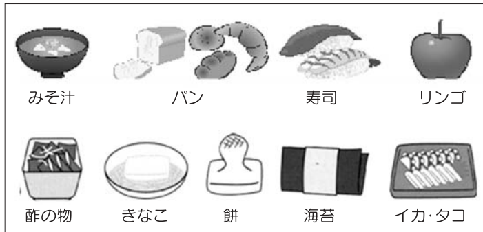
図2:ムセたり、のどに詰まりやすい食品例