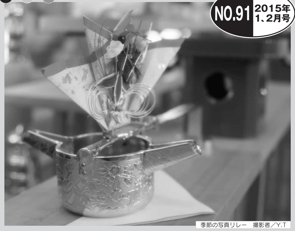
季節の写真リレー