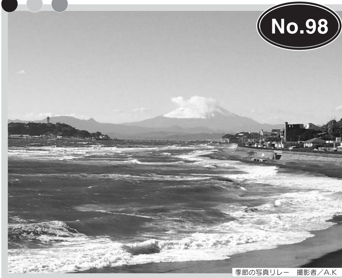
季節の写真リレー