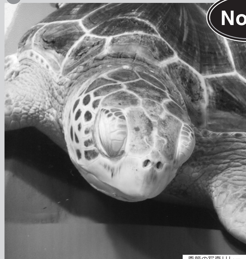
季節の写真リレー