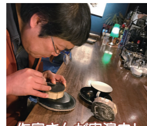
作家さんが表演中!