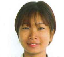
氏名 テ ッ テ ッ エー 所属部署 生活支援課 ひとこと

7月にミャンマーから来ました。“スさん”と呼んでください。ご利用者が快適で幸せな生活を送られるように頑張ります。