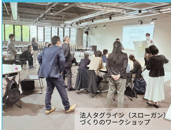
法人タグライン（スローガン）づくりのワークショップ