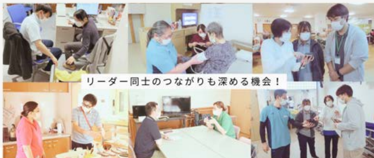
リーダー同士のつながりも深める機会！

リーダー職は、介護に対する心構え・めざす目標が高いことを認められているからこそ任命されています。周りの方々の強みを見つけて、得意分野でリーダーシップを発揮できるよう導いていくことも求められてきます。研修でのつながりを深めながら周りをまきこんで、チーム力・組織力を高めていきましょう！皆さまご協力よろしくお願いします！